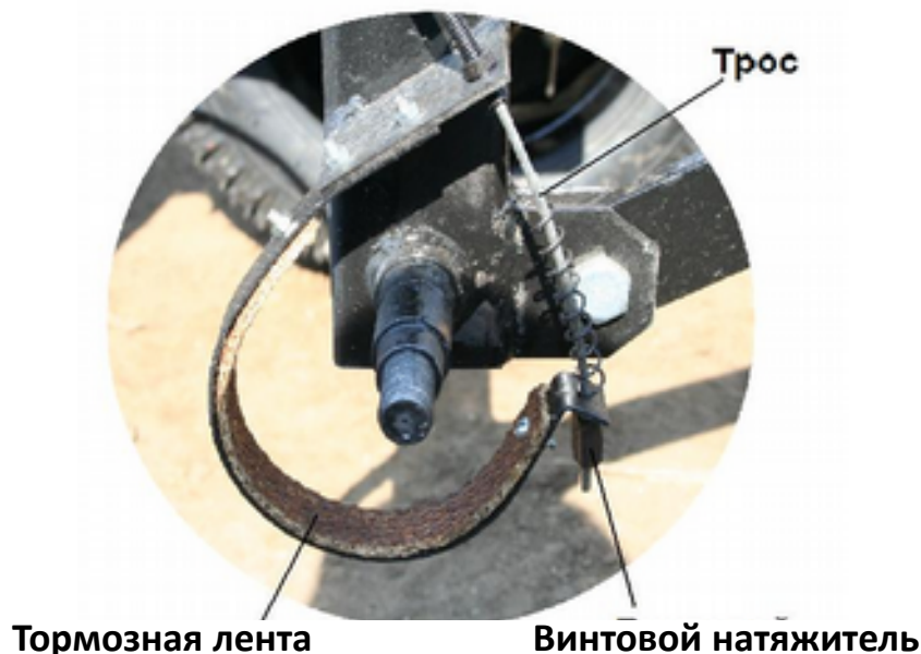
Рис. 2 Тормозная система